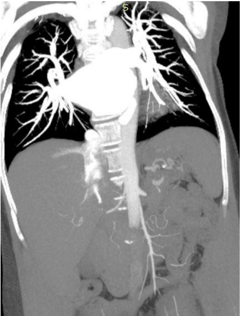
Imagen 1: Se realiza Angio TC y reconstrucciones , mip de 30 mm coronal de aorta abdominal