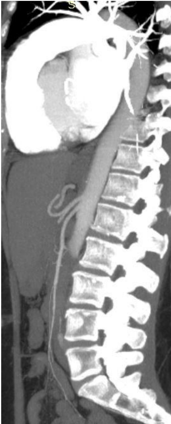
Imagen2:TC con contraste y reconstrucciones , MIP de 30 mm sagital de aorta abdominal se observa defecto de relleno por debajo de la emergencia de la arteria mesentérica superior