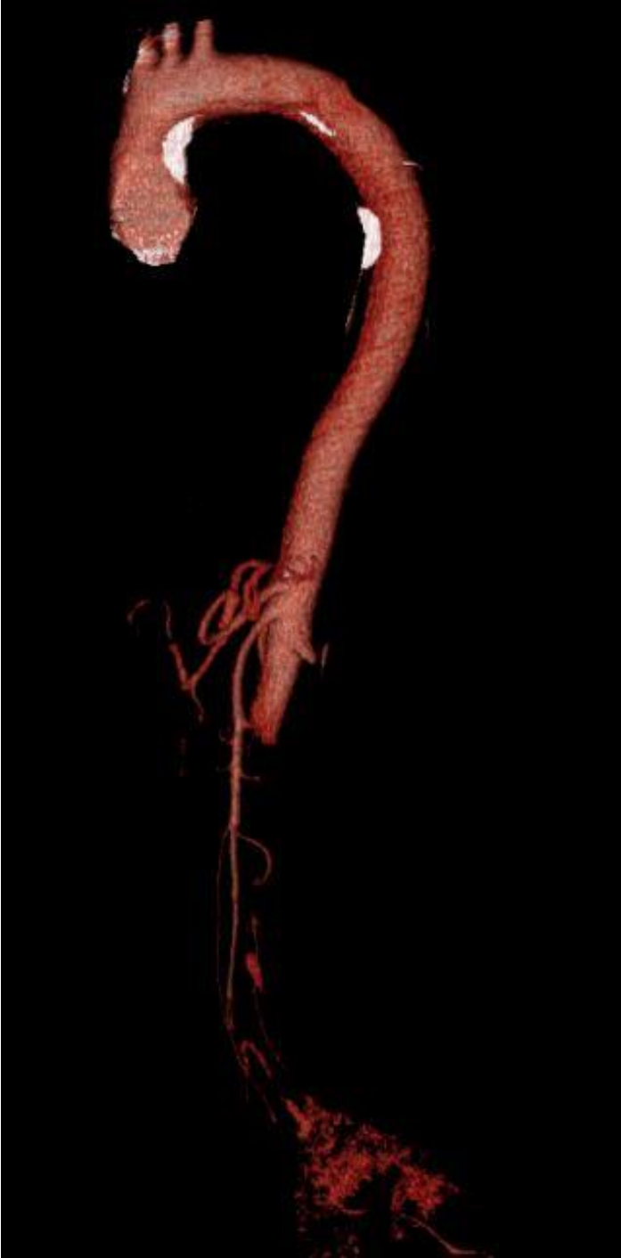
Imagen 3: TC con contraste y reconstrucción 3D de aorta abdominal